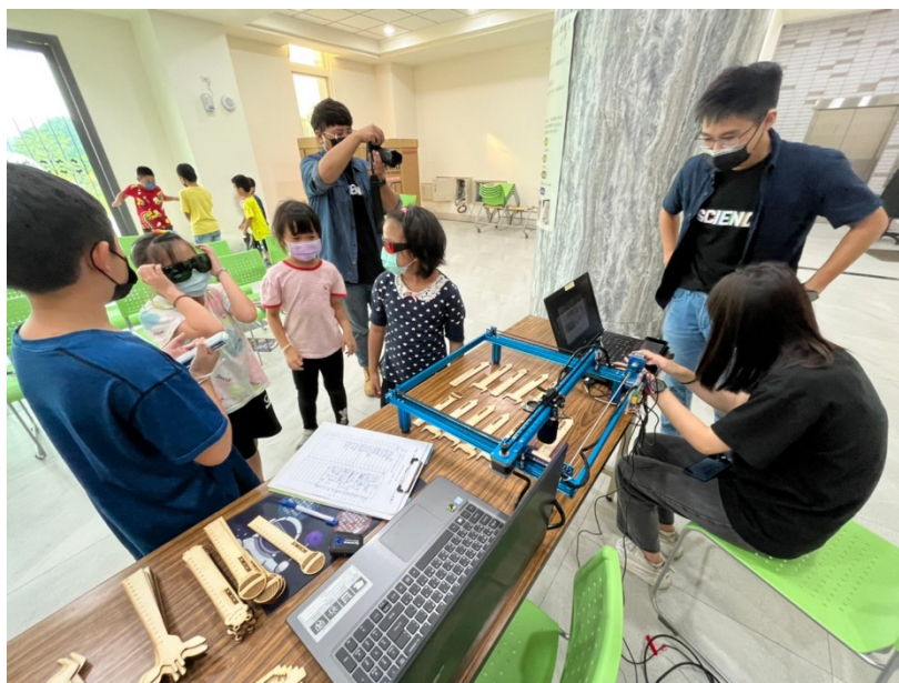
圖 4 觀察雷射雕刻運作過程

填畢問卷後，會讓在場的每位學童去挑可愛的造型尺，並讓他們決定想要客製化雕刻什麼在造型尺上，本團隊就會在現場雕刻給各位學童，並讓學生配戴護目鏡，由負責監督的團隊人員監管下，安全地觀察雷射雕刻機的運作全過程，如圖 4 所示。