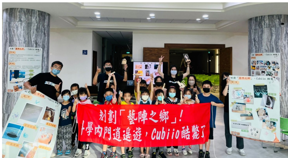
圖 12 11/23 活動圓滿成功團體照