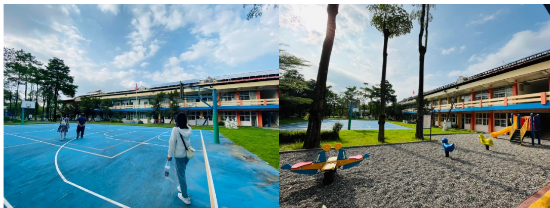
圖 1 木柵國小籃球場(左)、遊樂場(右)

木柵國小雖然佔地不大，但小學學校該具備的設備條件皆有，使學童在學習時不用擔心設備的問題。本團隊曾親臨到現場預先勘察活動場地，也順路參觀木柵國小的內部美景，如圖 1 所示，有寬敞的籃球場，也有學生的娛樂設施，下課遊玩之餘，也能到圖書館翻閱書籍增廣見聞，如圖 2 所示。