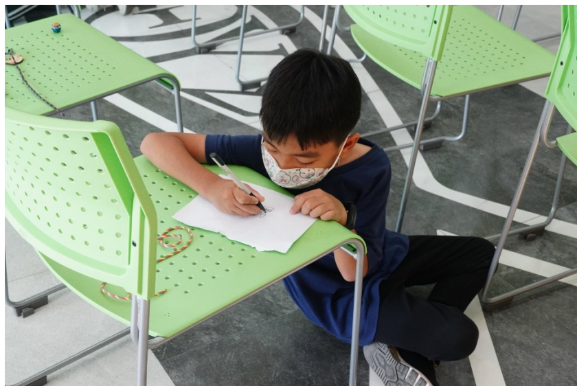
圖 8 手工繪製欲雕刻的圖案

接下來，就是要讓各位學生去繪製想要在鑰匙圈背面刻上什麼圖案，藉由學童的手和創意，將理想中的圖案給畫下來，再由手機掃描傳送到雷射雕刻機，來完成客製化加工，與上場活動不同的是，不再只有雕刻姓名文字，而是連手繪下來的圖案也能完成雕刻，如圖 8 所示。