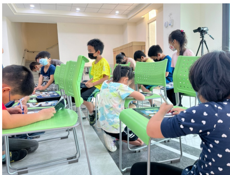
圖 3 填寫雷射小學堂問卷

11 月 23 日，本團隊以科普雷射雕刻知識為主軸，主要介紹雷射雕刻機、雷射光原理、雕刻工法呈現、生活應用等...來拉開雷射雕刻這塊領域和活動的序幕。在介紹過程中，我們會透過簡單易懂的簡報、生動的解說、實際展示，使學生瞭解雷射雕刻雖然是一份看似技術活，但只是透過經驗去決定簡易的參數該如何調整，讓電腦幫我們完成加工作業。待介紹結束後，會發放小問卷來驗收聆聽後的成果，如圖 3 所示，透過這種方式可以讓學童去思考問題，不懂就舉手發問，拉近我們與學生的距離，增加互動性。