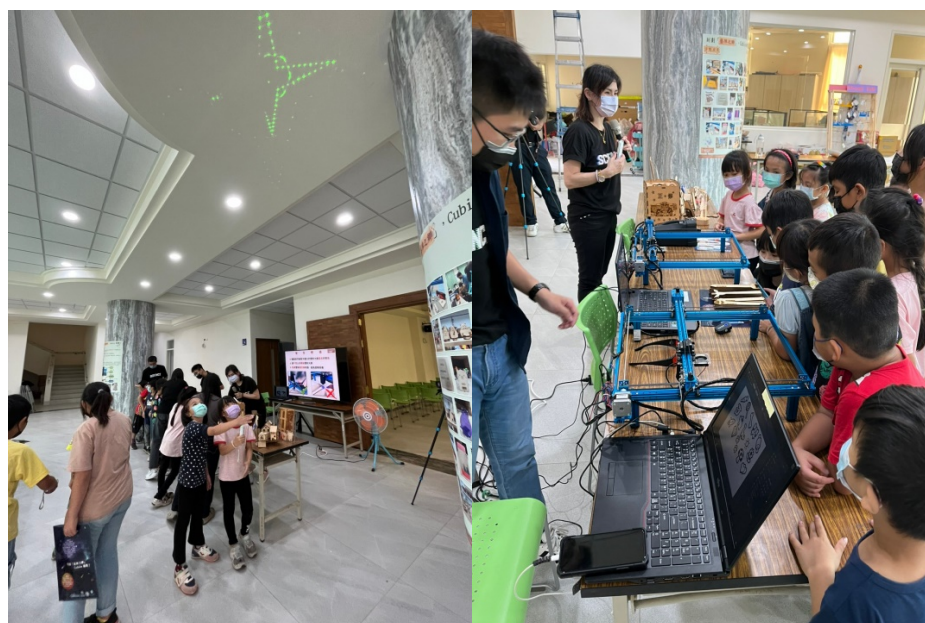
圖 5 把玩雷射筆(左)、展示成品(右)

學生們在等待自己的造型尺雕刻完成之餘，本團隊攜帶與雷射光相關的產品，例如雷射筆，還有雷射雕刻相關的不同材質展示品，使學生不只有看，還可以把玩和感受雷射雕刻帶來的產物，如圖 5 所示。