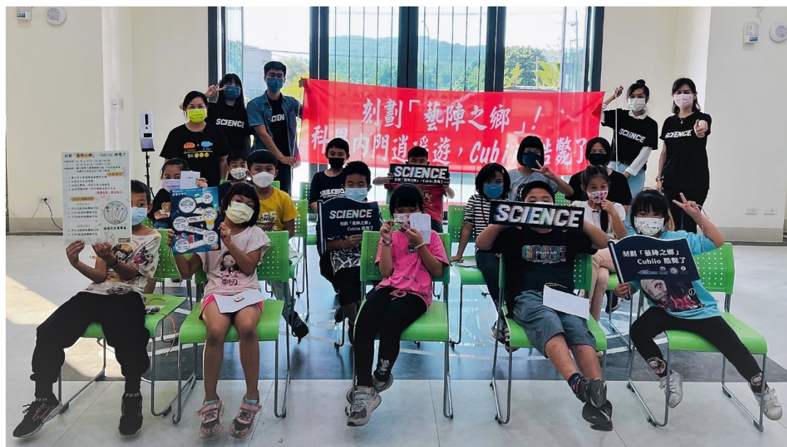
圖 13 11/30 活動結束團體照