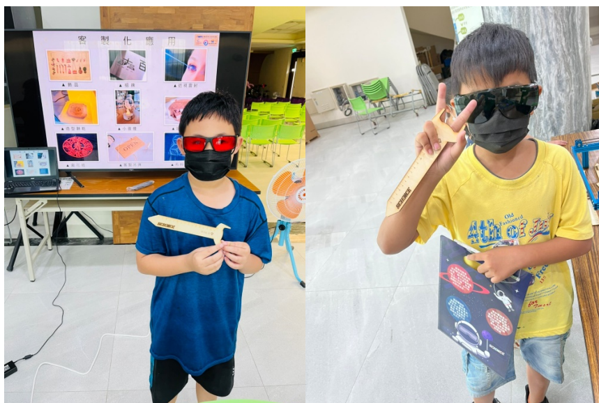
圖 6 可愛造型尺合照

當團隊人員幫在場所有師生完成雷射雕刻後，此次的活動也圓滿的告一個段落，期待下次 11 月 30 日的活動舉辦，如圖 6 所示。