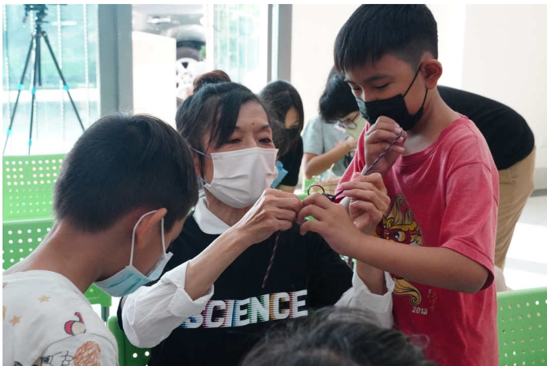
圖 10 手把手編織教學