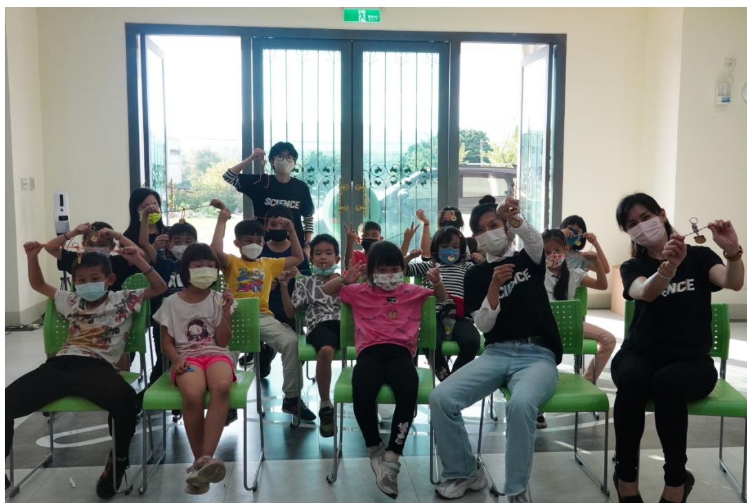
圖 11 完成編織鑰匙圈成果