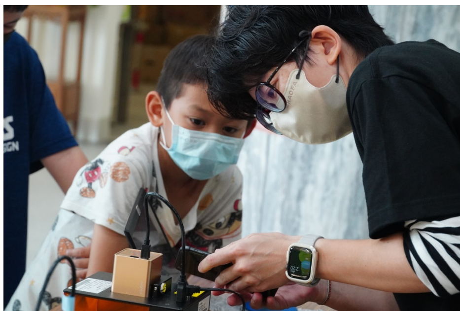
圖 9 透過手機掃描並操作雷射雕刻機

待每位學童發揮創意並繳交繪畫圖紙後，本團隊人員會幫忙將繪畫圖紙掃描傳送到雷射雕刻機，由本團隊人員操作雷射雕刻機完成雕刻加工，如圖 9 所示。等待機器完成加工之餘，本團隊成員手把手帶動學童的手，慢慢一步步的編織鑰匙圈的繩結，如圖 10 和圖 11 所示。