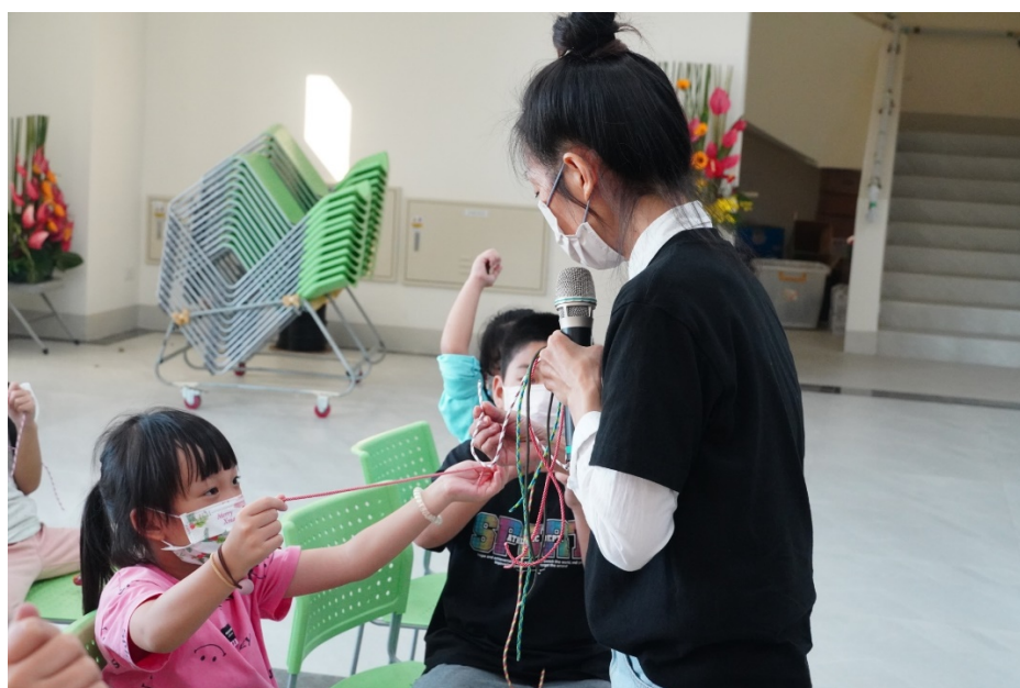
圖 7 挑選喜愛的傘繩樣式

活動過程中，我們將短暫複習上次介紹過的雷射雕刻機，並採與上場活動不同的雷射雕刻機，來完成此次整場活動雕刻工作的重點。在雕刻工作開始前，會讓在場各位學生先挑選喜歡的傘繩樣式，如圖 7 所示。