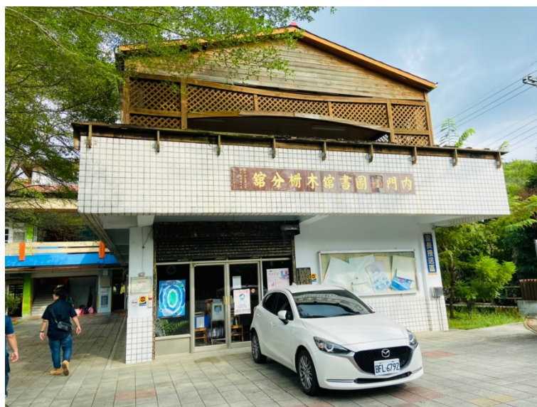
圖 2 木柵國小圖書館

本團隊將此次科普教育活動分為兩次進行，分別帶入不同主題以及內容，以多元化的方式進行教學，使學生較不會倦於活動過程，進而沉浸在雷射雕刻主題的洗禮。